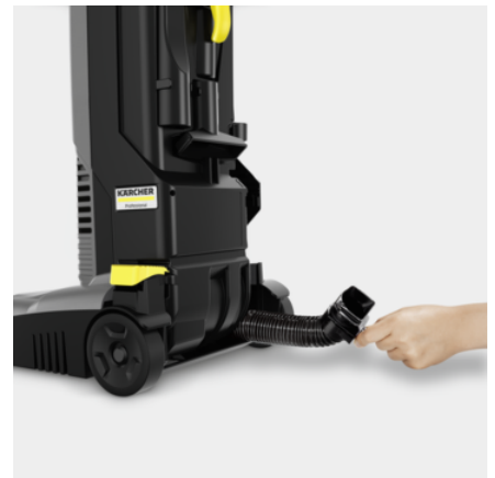
Óptimas posibilidades de limpieza con flexibilidad