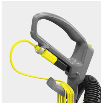
Sistema de sustitución rápida para cable de red