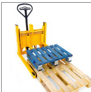
Manipulación de palets de la mitad del tamaño de un europalet estándar