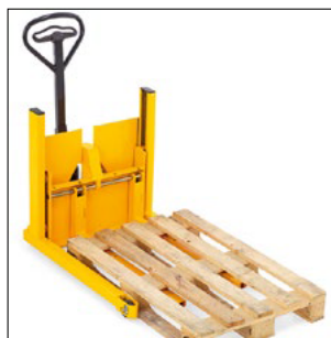
Toma de un palet europeo estándar