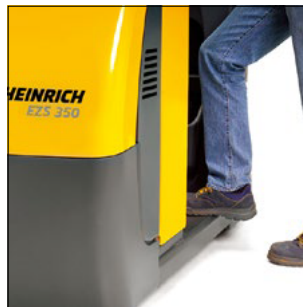
Subir y bajar sin esfuerzos