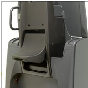
Respaldo con asiento abatible