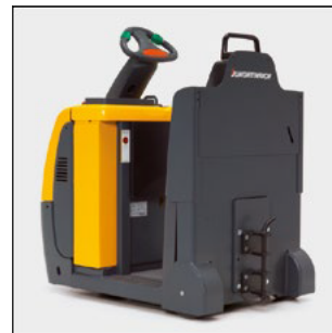
Diferentes acoplamientos disponibles (opcionales)