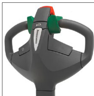
Barra timón ergonómica