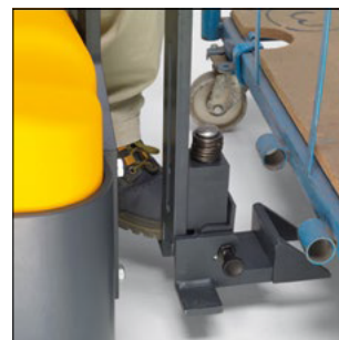
Soluciones de enganche individualizadas adaptadas al remolque