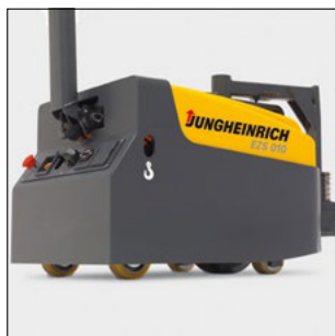
Elementos de manipulación claros y a la vista